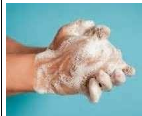
Lavaggio con acqua e sapone